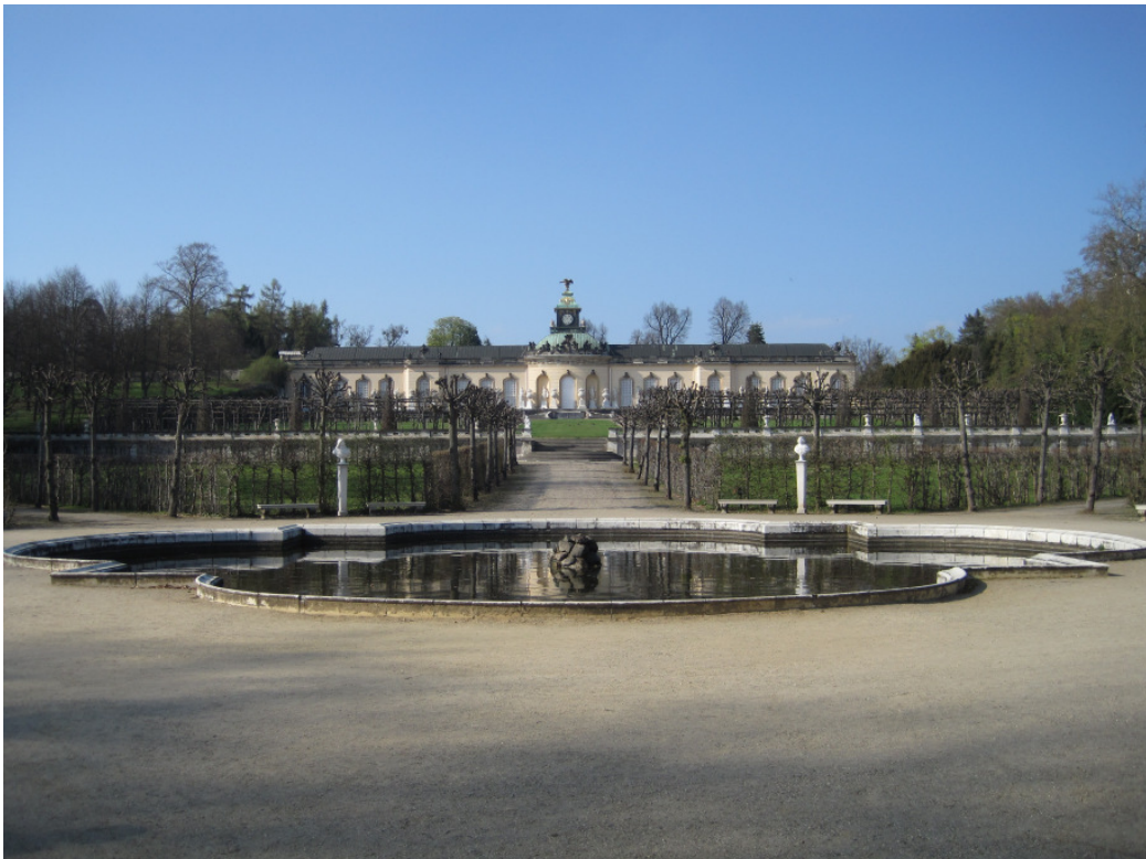
Brunnen auf der Rückseite der Bildergalerie, Park Sanssouci, 2013

am Brunnen vor der Bildergalerie im Park Sanssouci